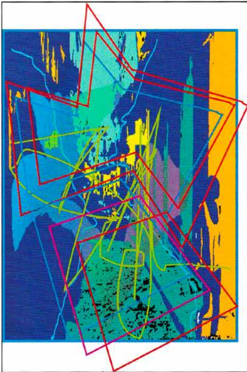
Rua de Salvador