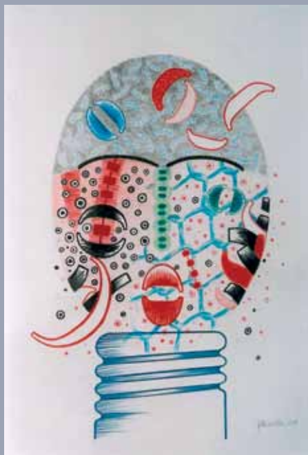
Jette With Portrait de la mer, 2011