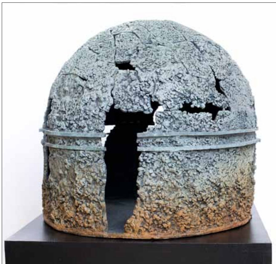
Kupler - dome or die. En serie skulpturer af Gerda Thune Andersen

Undertitlen på denne serie skulpturer af kupler og hvælv, Kupler- dome or die, parafaserer over den engelske talemåde Do or die og er en kommentar til den værdistrid der eksisterer imellem de tre monoteistiske religioner, Islam, Kristendom og Jødedom, som finder sted i forstærket form netop nu. Der er et ensidigt og destruktivt fokus på de forskelle, der skiller os, frem for de ligheder, der forbinder. Vælger man at lede efter samlingspunkterne, findes der overraskende mange fællestræk i det åndelige værdigrundlag, som vores religiøse og kulturelle arv bygger på, og mange af disse ligheder findes materialiseret i mange forskellige former i arkitektur og kunst.