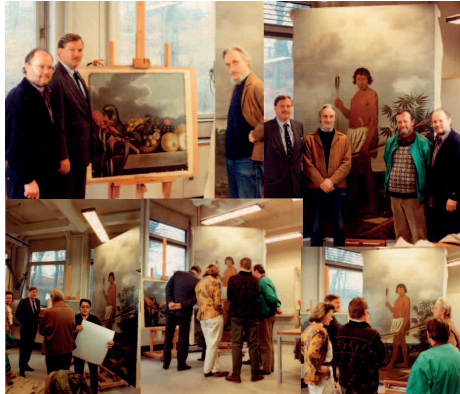
På Nationalmuseets konservatorafdeling i Brede: Besøg for opnå kontakt med Nationalmuseets ledelse om at låne Eckhouts værker til en storslået udstilling i Brasilien.