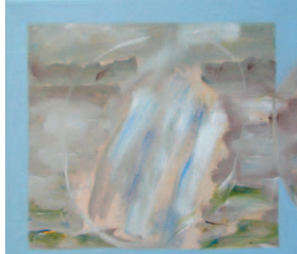
In vino veritas - vinho tinto - maleri med rødvin fra Natal, Brasil